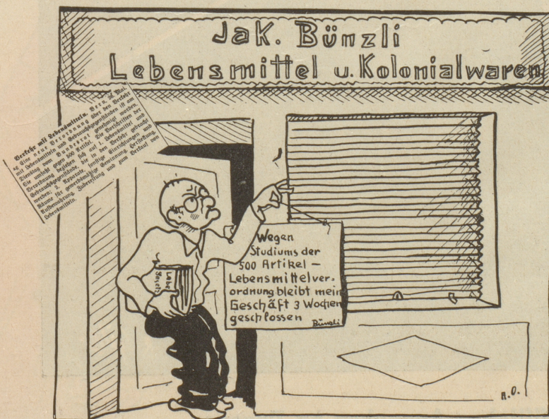
Tragische Folgen einer bundesrätlichen Verordnung.