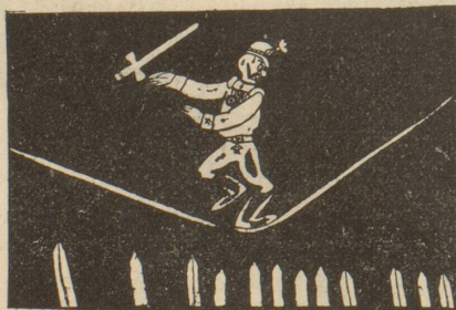
Ein gefährlicher Seiltanz