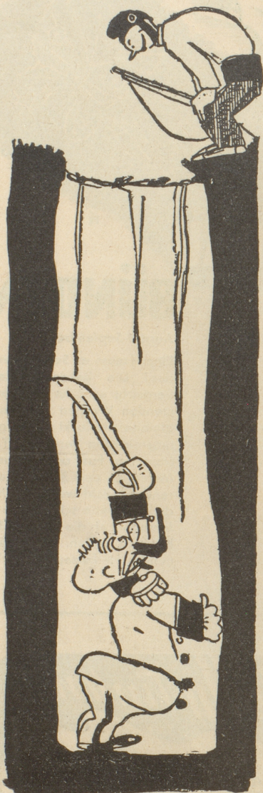
Der General: «Wenn Du mich sofort herauslässt, dann will ich Gnade für Recht ergehen lassen!»