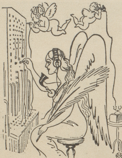
Die Verbindung mit Spanien scheint irgendwie defekt!