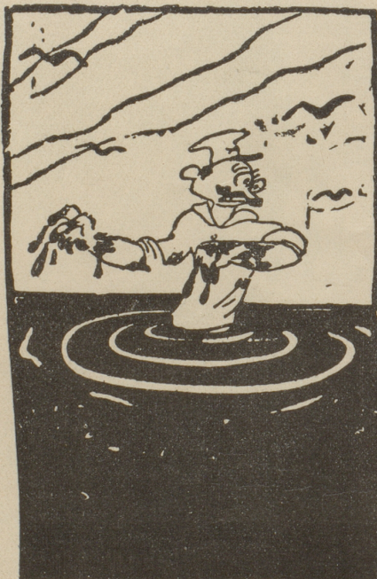
Das Blutbad «Hilfe! Ich ertrinke!»