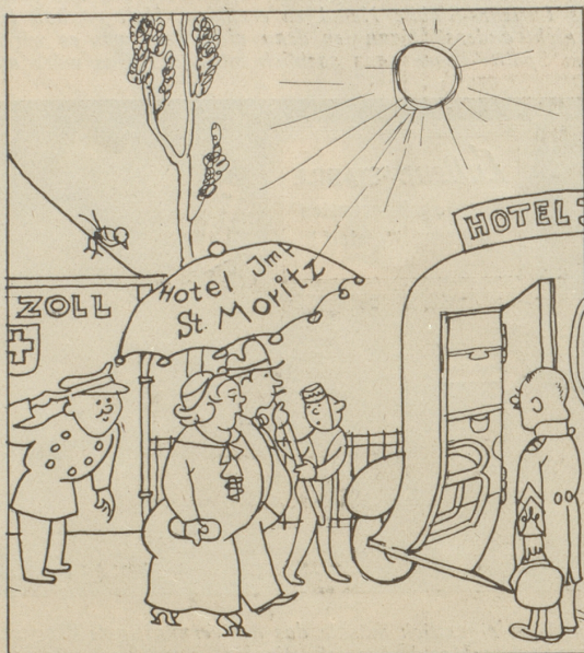
1. Der Fremde wird an der Grenze mit dem Hotel-omnibus abgeholt und gratis zum Hotel gefahren. (Um den Ausfall, den die S.B.B. dadurch erleidet, können die Fahrtaxen für die Eingeborenen erhöht werden.)