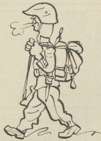
11) Guet, mached d'Hättli uf und dr Oberscht Chnopf!