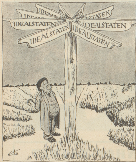
Der Wegweiser nach Idealstaat von den verschiedenen Parteien gemeinsam gestiftet (Söndagsnisse Strix, Stockholm)