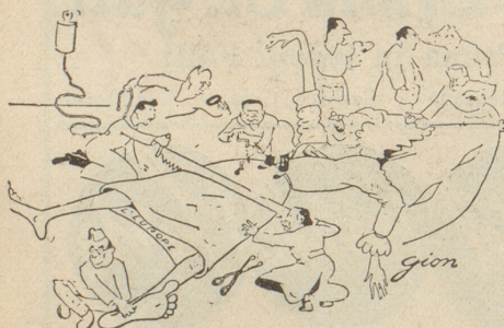
Bemühungen um Europa .... wenn das nicht hilft ... (Mömentul, Bukarest)