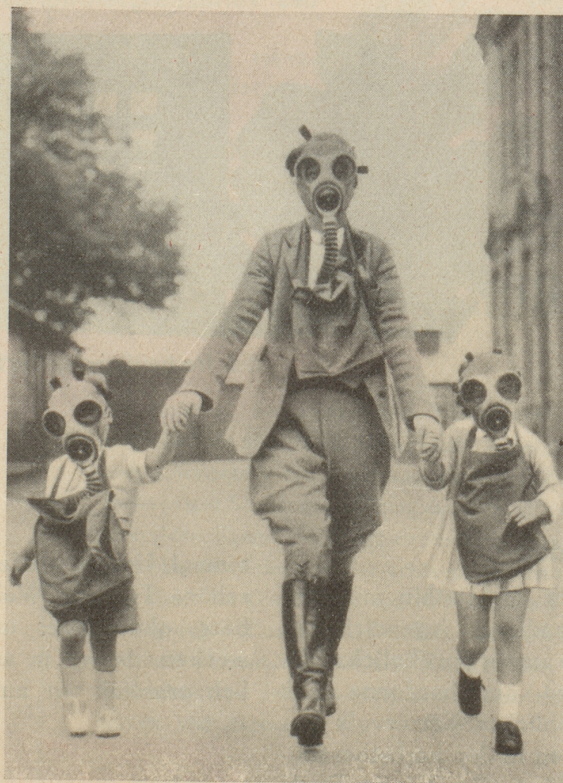
Das Gesicht unserer Zeit Engländerin mit ihren Kindern an einer Luft- und Gasschutzvorführung Aus «Frauen- und Modezeitung»

Die Preisfrage Bö's: Wie viel Bier muss einer nicht trinken, bis ...» wäre demnach dahin zu erweitern: «... bis einer z. B. weiss, dass ein berühmter und älterer Kollege, die satirische englische Wochenzeitschrift