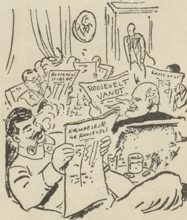
«Der hat leicht regieren, wo er das ganze Volk hinter sich hat!»