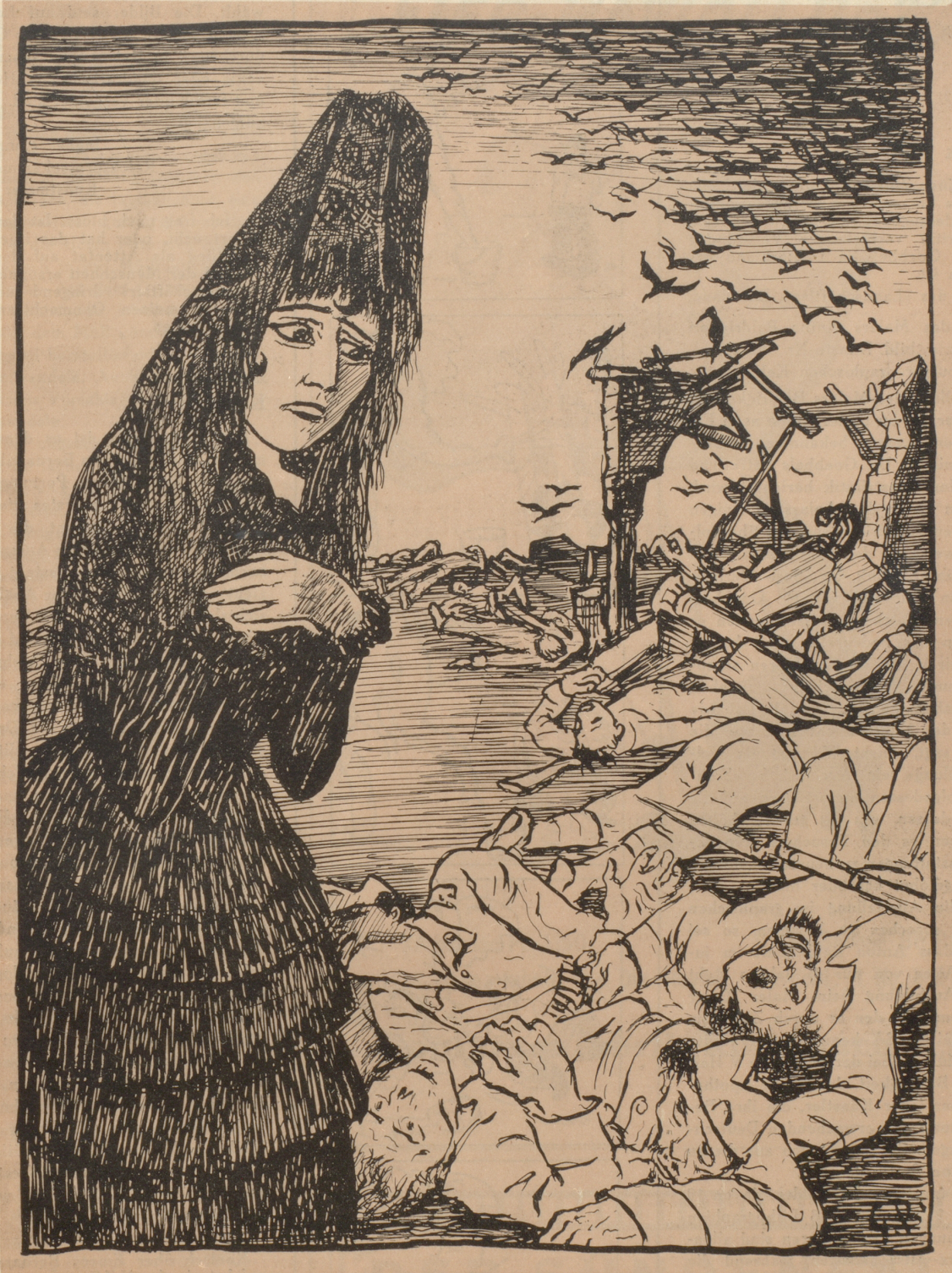
Spanien: „Sie haben um mich gekämpft, bis keiner mehr da war, mich heimzuführen!“