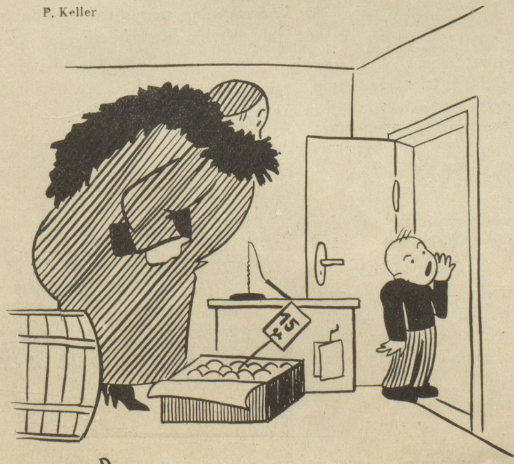
«Vatter chumm — 's Gschäft isch voll!»