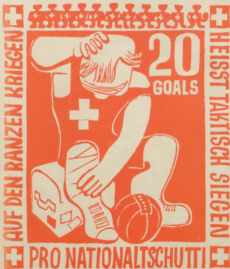
Aus der Serie: Neue Schweizer Briefmarken