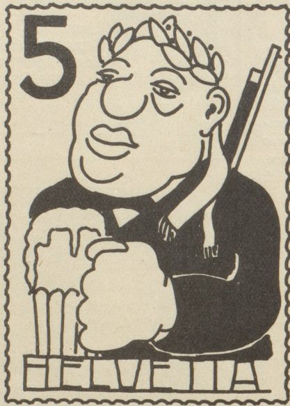
Ein zeitgemässer Tell