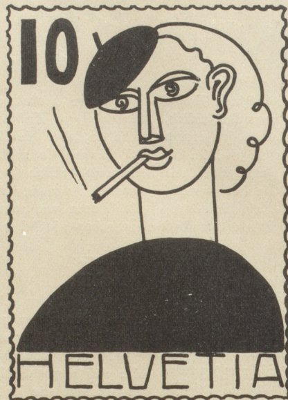
Eine zeitgemässe Helvetia