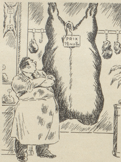
Die Preise sollen wir heruntersetzen ...