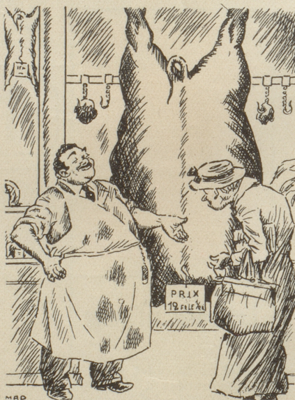
.... schön .... setzen wir die Preise herunter!