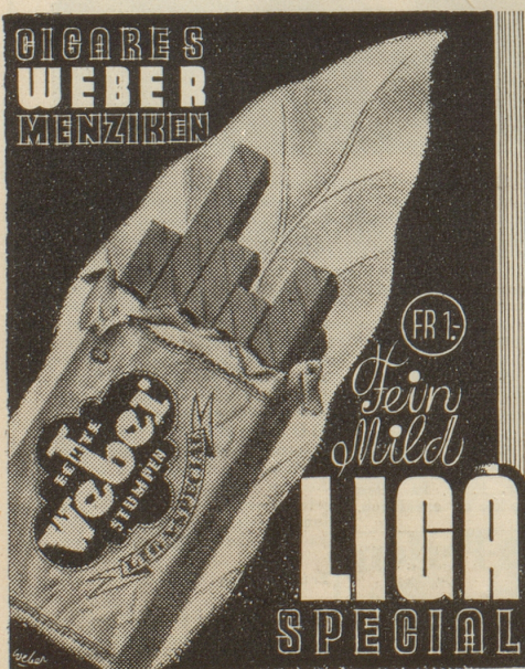
Weber-Stumpen sind einzigartig!

Der hohe Uebernahmepreis durch den Bund hatte zur Folge, dass es vielen Bauern rentabel war, ihr Tafelobst zu brennen. Die Revision des Alkoholgesetzes wird vor allem den Uebernahmepreis so festzusetzen haben, dass solcher Unfug nicht mehr rentiert. Der Bauer hat sonst gar kein Interesse zum Tafelobstbau überzugehen. (Das schon im ersten Gesetz berücksichtigt zu haben, hätte dem Scharfsinn der Verfasser sehr zur Ehre gereicht!)