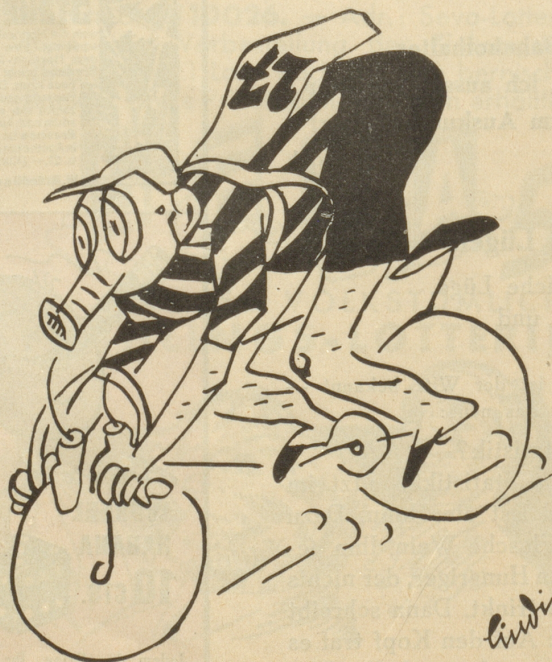
Ein Bildchen von der nächsten Tour de Suisse

Er hat zwei harbe Rappen Sein Zeugerl steht am Graben,