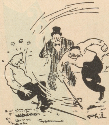
Beim Duell «Halt! Das ist gegen das Reglemang!» Ric et Rac

... dass nämli zu unserem Bild-Ideen-Wettbewerb nur 3 (in Worten: drei) gute Beiträge eingehen. Wir verlängern den Einsende-Termin bis 21. Juli (21 = 3 mal 7). Wettbewerbs-Bedingungen siehe ohne Ausnahme Seite 19. Bö und Beau.