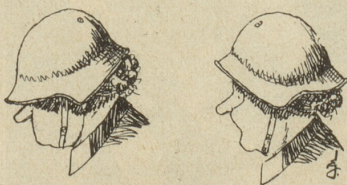
Weibliche Luftschutztruppe Zürich. Stahlhelm und Zöpfchen.

des zweiten Tages sieht sie, dass es nicht so einfach sein wird, schnell wegzukommen, da die Kleideranfertigung etliche Tage in Anspruch nimmt. Sie schreibt ihrem Bräutigam ein etwas konfuses Eilbriefchen: «Muss mir noch einige Kleinigkeiten anschaffen, bloss acht bis zehn Kleidchen und die dazu passenden Hüte. Dann fliege ich in Deine Arme, Bussi! Deine Lizzy.» Zwei Tage später erhält er — der eigentlich findet, dass es genügen würde, wenn sie mit einem statt mit acht bis zehn Kleidchen in seine Arme fliegen würde — einen neuen Brief: «Die dumme Schneiderin wird mit meinen Sachen ewig nicht fertig! Denke doch, ich muss auch noch auf das blaue Hütchen warten, und das ockerfarbene ist auch noch nicht fertig! (Man sieht ja, ein Unglück kommt nie allein!) Du, Krokodilleder-schuhe habe ich mir gekauft — zum Küssen! Bald komme ich. Und dann werden wir von den tausend Franken fein leben!»