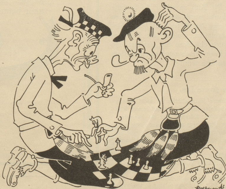
Die sparsamen Schotten