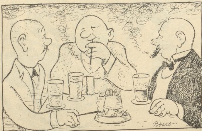
Ein Ausländer: Liebe Eidgenosse, ihr seid z'beneide, ihr habt 's reinst Paradiesle!