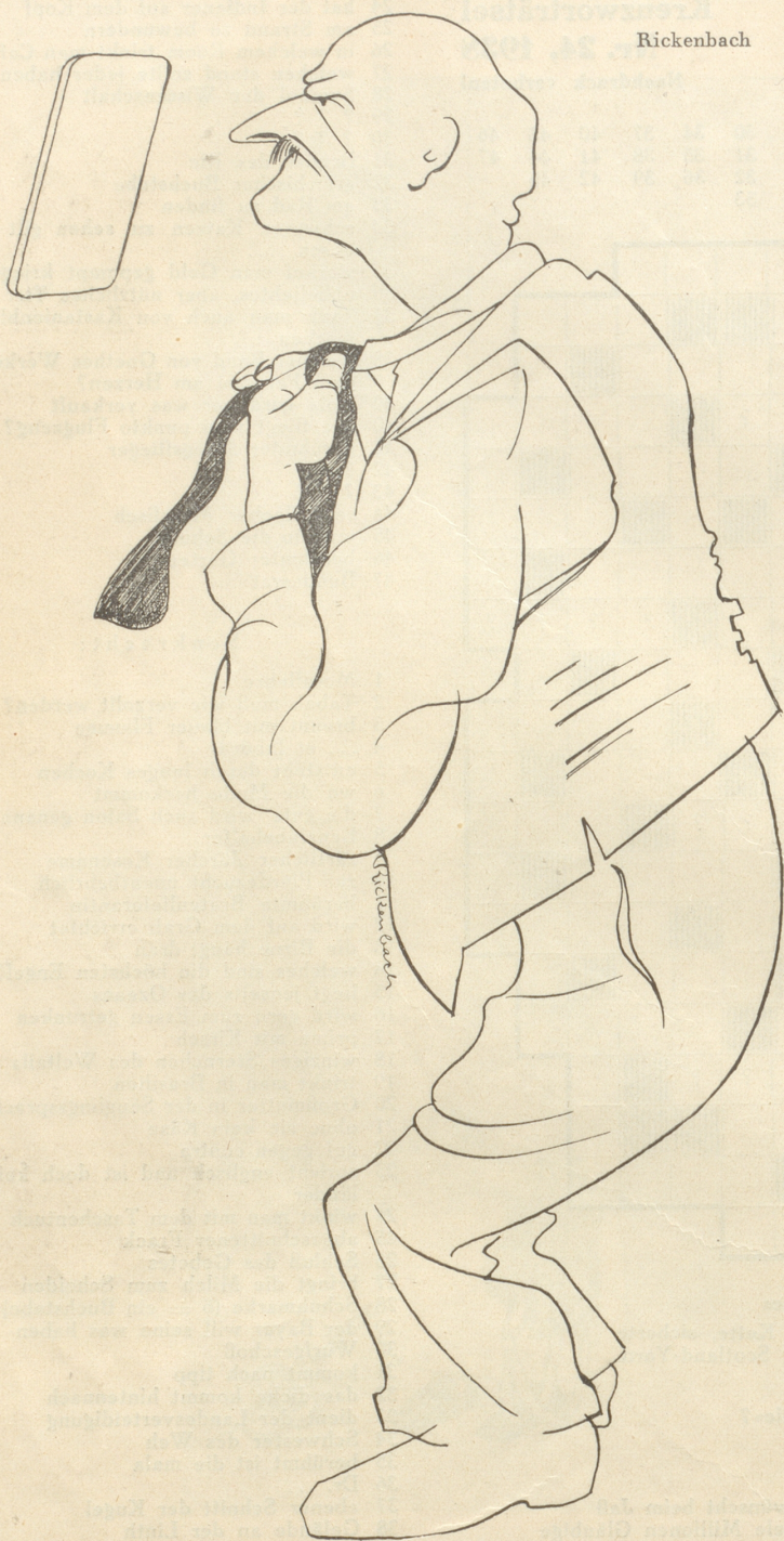
De Vatter mueß as Telifon