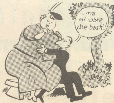
Seine Große Liebe