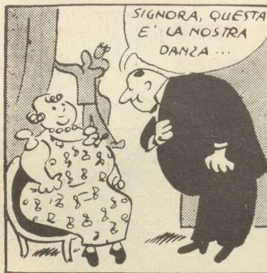
Der Tanz des Elefanten