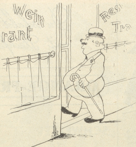
wo der Schlemmerli nicht vorbegehen kann