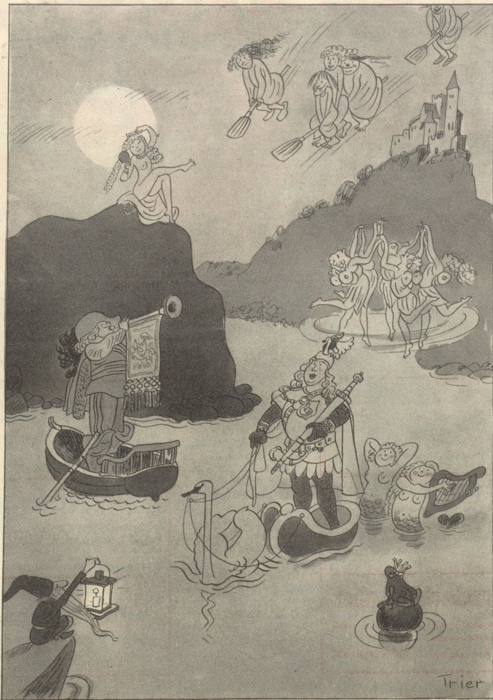
Der Rhein in der Romantik