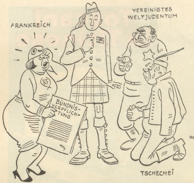
Nationalsozialistische Karikatur über Frankreich und England

Himmelherrgott, jetzt zählt der schon wochenlang die Knöpfe ab!!