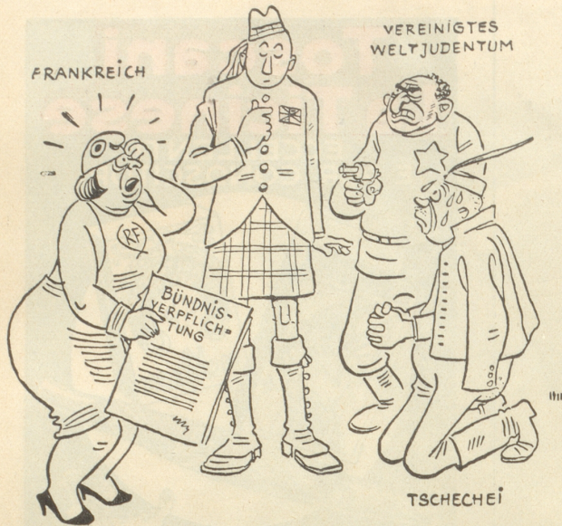
Nationalsozialistische Karikatur über Frankreich und England

Himmelherrgott, jetzt zählt der schon wochenlang die Knöpfe ab!!