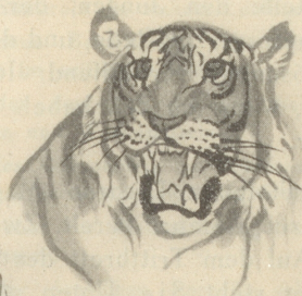
Eine japanische Neujahr-Glückwunsch-Karte, die nach Europa versandt wurde. Ein zeitgemässer Bild-Gruss an die weisse Rasse.

das Recht, die Zeitung mit mir zu lesen und das passte mir schon gar nicht. Na, ich habe ihn denn auch richtig geärgert und mir gestattet, anstatt zu lesen, von Zürich bis nach Wil (ich fuhr nach St. Gallen) das Kreuzworträtsel möglichst langsam, aber eingehend zu lösen. Ich sah ihm direkt an, wie ihn das ärgerte; vor lauter Aerger hat er vor allen Leuten Toilette gemacht. Als wir aus dem Zug stiegen, sah er direkt schön aus.