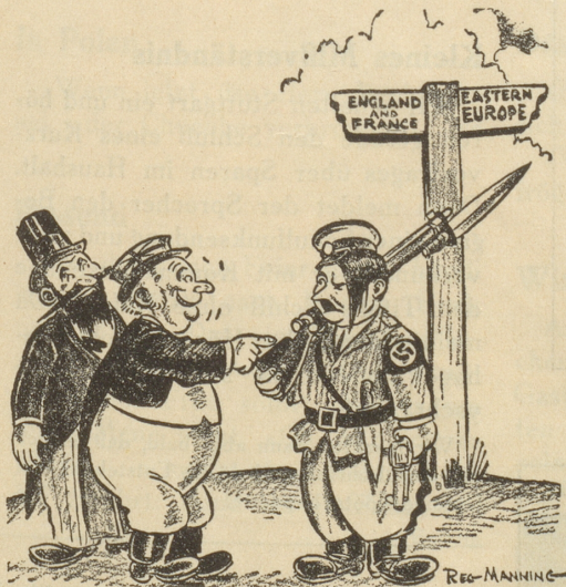
«Geh ostwärts, junger Mann!» («The Salt Lake Tribune», U.S.A.)

Zwischen Stadttheater und Landesausstellung, Tramhaltestelle Kreuzplatz.