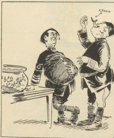
Meisterschaftswettbewerb im «Goldfisch-Schlucken».