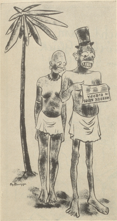
«Das sind doch ruchi Hagle z'Europa hine!»