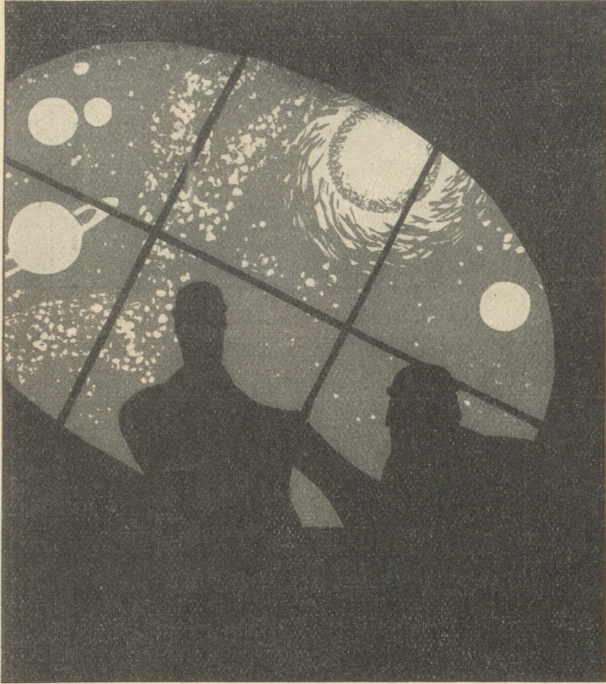
1930. Gespräch im Raketenraumschiff: «Donnawetta — großzügige Lichtreklame — wat? Wenn det erst mal industrialisiert ist!»