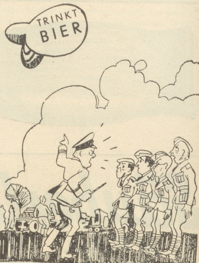
«Wer hät jetzt das mit der cheibe Reklame wieder gmacht?!»

ist, wenn bei Wahlen in andern als den Kantonen St. Gallen und Appenzell Spitzenkandidaten aufgestellt werden. Spü