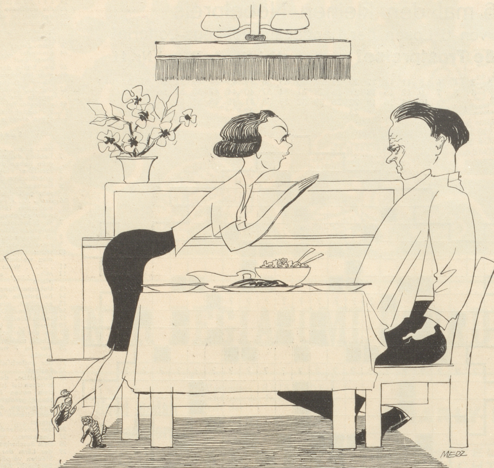
Das erste Mittagessen