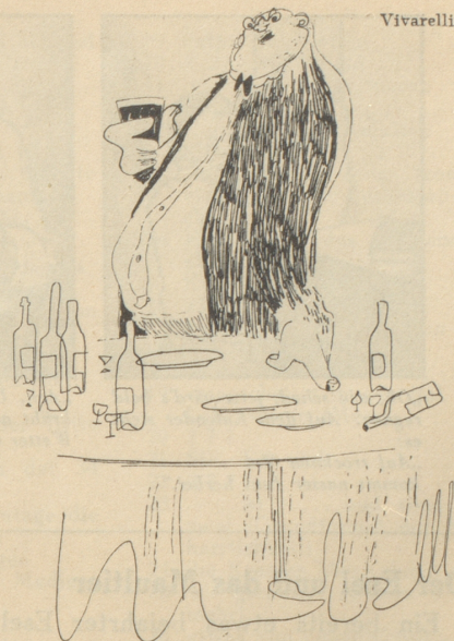
Der alkoholisierte Tischredner

«Auch ich werde bis zum letschten Tropfen durchhalten!»