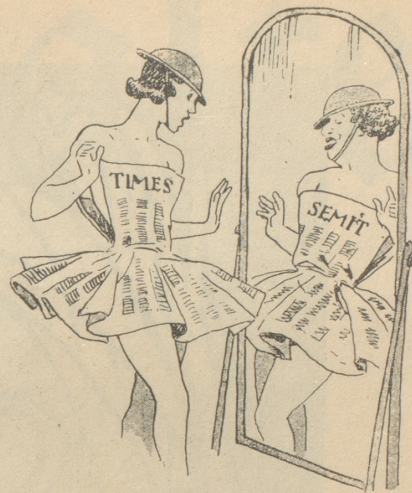
Der Berliner «Kladderadatsch» sieht die «Times» im Spiegel.

Kellner am Buffet: «Zwei Beefsteaks, eines davon weich!» Ohu