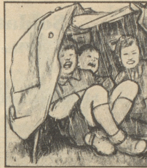
O weh, jetzt hat sie das Gewitter doch noch überrascht. Die besorgten Mütter zu Hause haben alle vor Erkältung gewarnt.