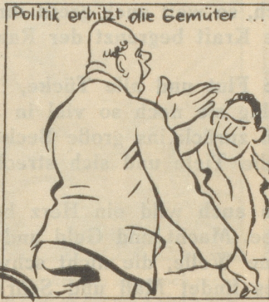
Politik erhitzt die Gemüter ...