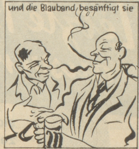
und die Blauband, besänftigt sie