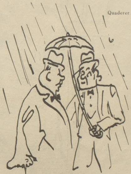
«'s isch immer na gschyder, 's rägni jetzt, als bim schöne Wätter!»

Gelt, lieber Nebi, es gibt doch noch anständige Leute, trotz den schweren Zeiten! Chutz