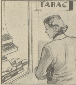
Gleich am nächsten Sonntag soll er ein Päckli haben. „Wenn ich nur wüsste, was er mag: Cigaretten, Stumpen oder Tabak?“