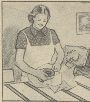
„Von jedem etwas. Und dazu eine grosse Schachtel Caba, die ist sowieso recht.“