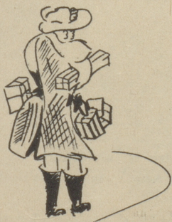
Alles für eine

«Jä», isch dä eigetli eso tür?» fragt Margritli die sprachlose Tante. K-k