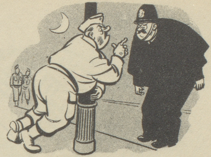
«Ahaa! Sie spionieren Truppenbewegungen!» Englischer Humor aus «Humorist»