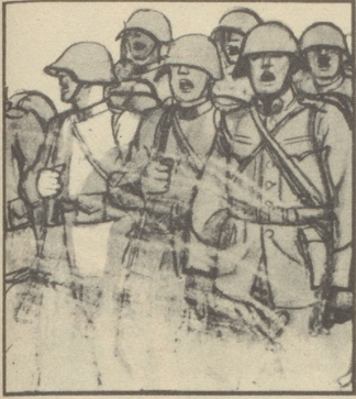
„Was tschumpelt im Kaput dahär Bi Sunneschy und Schnee? Das sind die Füsiliere Mit ihrem L. M. G.“