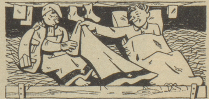
„Du chasch e Decki vo mir ha, ich ha warm gnueg i mym Schlafspätz.“ „So eine wott i dän au!“ „Da bruchsch nu a de Spätz z'schrybe.“