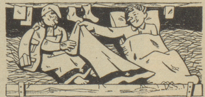
„Du chasch e Decki vo mir ha, ich ha warm gnueg i mym Schlafspätz.“ „So eine wott i dän au!“ „Da bruchsch nu a de Spätz z'schrybe.“