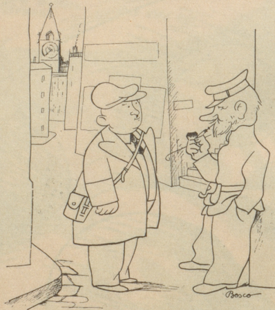
In der Großstadt Züri