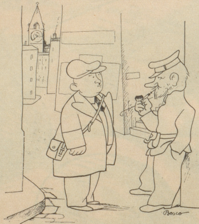
In der Großstadt Züri