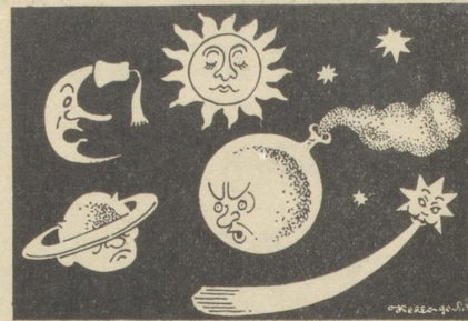
Wir, aus Distanz gesehen!

«Ich riskiere es,» dachte A. «und läute ihn an, er wird doch die kleine Gefälligkeit einem Verwandten nicht versagen!» - «Genosse Stalbunow?» «Am Apparat.» «Lieber Onkel Theodor, ich bin es, Dein Neffe Arkadi. Du kannst Dich noch meiner entsinnen?» Das Hörrohr ließ eine unwillige Bejahung der Frage vernehmen. «Wie geht es Onkelchen?» «Nitschewo.» Das Zwiegespräch stockte. A. zermartete sein Hirn nach einer passenden Anknüpfung, um nicht ohne weiteres wegen des Kragens ins Haus zu fallen, und schon flossen in das Sprachrohr wie von selbst, dunklen Gesetzen des Erinnerns gehorchend, die Worte: «Wie ist das geworden mit dieser ... sozusagen Münze? Beunruhigt sie Dich noch?» «Welche Münze?» «Nun die,