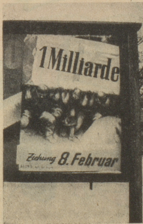
Isch das nüd Ufschnitt?