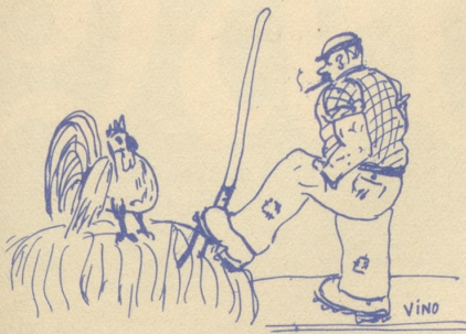
Sommerzeit auf dem Lande De Puur gaht go de Guggel wecke.