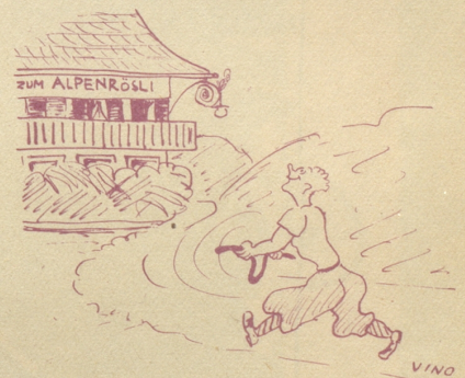
Der Rutengänger: «Mys Rüelli schlaat us, 's hüt sicher öppis Füechts i de Nächli!»

S. M. und der Fürst halten sich dato zur Kur in Kandersteg auf. emka.