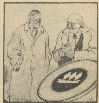
„Ich gehe nie ohne Gaba auf die Reise! Gaba ist die Reiseversicherung gegen Husten und Heiserkeit.“