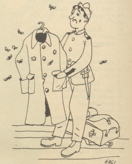
Vor dem Einrücken

Im September 1940 machten wir mit unserm Hauptmann (Kommandant einer welschen Kompagnie) eine Rekognoszierungstour. Da es fortwährend regnete, begaben wir uns in einen nahe liegenden Bauernhof, dessen Bewohner nur schlecht französisch sprachen. Die Bauersfrau stellte uns ein Zvieri vor, das uns ganz besonders schmeckte. Beim Weggehen dankte ich, als einziger Deutschschweizer der Rekognozierungsequipe: «Danke rächt hätzli. Si händ is do e bäumigs Zvieri offeriert.» Darauf die Bauersfrau: «- - Oh - - jä - -, jetzt han i gmeint, dr seiget Interniertil!» P. W.